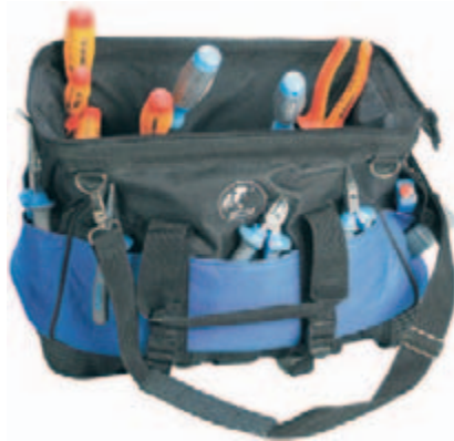
Gran espacio para más herramientas