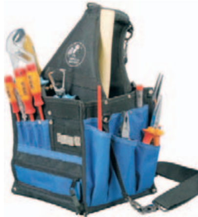
Caja de plástico para pequeños artículos

Compartimentos para 26 herramientas MEDIDAS: 440x330x230 mm. MATERIAL: Polytex. PESO: 2,0 kg.