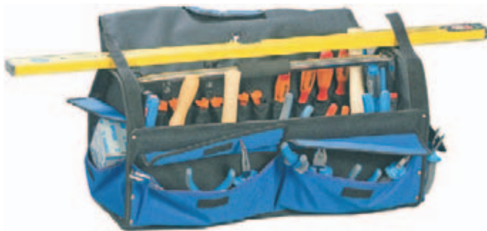
6 grandes Bolsillos alrededor

Cinturón porta herramientas Compartimentos para 24 herramientas MATERIAL: Polytex. PESO: 0,6 kg.