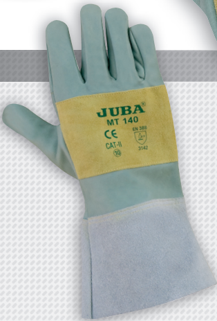
MT 140 versión manguito