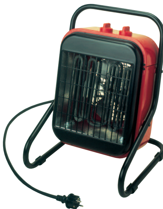
DIMENSIONES ( m m )

Dispone de un botón de rearme manual (RESET) que los conecta nuevamente.